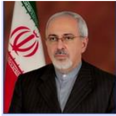
وزیر امور خارجه دکتر محمد جواد ظریف