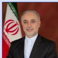
معاون رئیس‌جمهور و رئیس سازمان انرژی اتمی