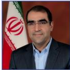
وزیر بهداشت، درمان و آموزش پزشکی دکتر سید حسن قاضی زاده هاشمی