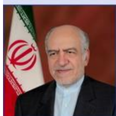
وزیر صنعت، معدن و تجارت