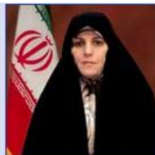
معاون رئیس‌جمهور در امور زنان و خانواده