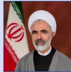
معاون حقوقی رئیس جمهور حجت الاسلام والمسلمین مجید انصاری