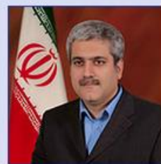
معاون علمی و فناوری رئیس جمهور دکتر سورنا ستاری