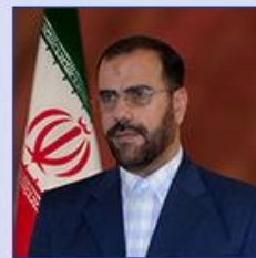
معاون رئیس جمهور در امور مجلس دکتر حسینعلی امیری