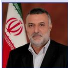
وزیر جهاد کشاورزی مهندس محمود حجتی