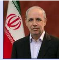
معاون رئیس جمهور و رئیس سازمان اداری و استخدامی کشور جمشید انصاری