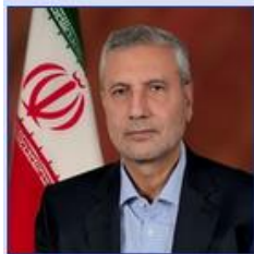
وزیر تعاون، کار و رفاه اجتماعی دکتر علی ربیعی