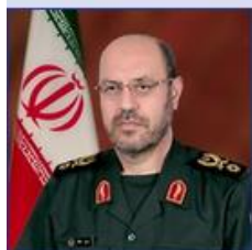
وزیر دفاع و پشتیبانی نیروهای مسلح