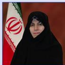
معاون رئیس‌جمهور و رئیس سازمان میراث فرهنگی، صنایع دستی و گردشگری