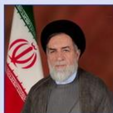
معاون رئیس‌جمهور و رئیس بنیاد شهید و امور ایثارگران