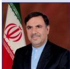
وزیر راه و شهرسازی